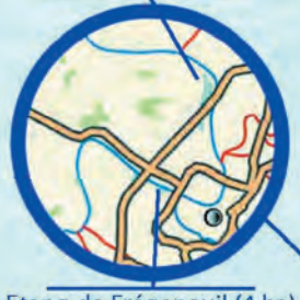
Etang de Frégeneuil (4 ha)